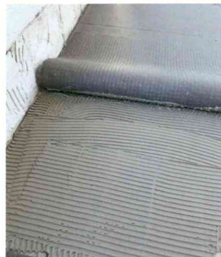
Da ein Abriss des Bestandes möglichst vermieden werden sollte, fiel die Wahl auf Triflex ProDrain.

Umrahmt vom prächtigen Alpenpanorama der Hohen Tauern bietet das Hotel Rauter in Matrei seinen Gästen eine attraktive Unterkunft. Nach Jahren der Nutzung zeigten sich an den Balkonoberflächen jedoch risige Fliesen und Abplatzungen. Sie trübten das Urlaubsambiente und machten eine zügige Instandsetzung erforderlich. Der Bauherr beauftragte damit die DIG Dach GmbH, Lienz. Gefragt war eine Lösung, die ergänzend zu einer dauerhaft funktionstüchtigen Abdichtung das Austrocknen der zum Teil durchfeuchteten Bausubstanz gewährt. Für diese Herausforderung setzten die Verarbeiter Triflex ProDrain ein: Dank integrierter Entkopplungsbahn leitet es Feuchtigkeit aus dem Untergrund dauerhaft ab. Das Balkon Abdichtungssystem Triflex BTS-P auf Polymethylmethacrylat-Basis (PMMA) ist eine witterungsstabile Premiumabdichtung, die optisch individuell gestaltet werden kann. In Kombination sorgen beide Systemlösungen für einen langlebigen Schutz der Bausubstanz, der sowohl optisch als auch funktional den Anforderungen der Urlauber entspricht. Fliegenfischen, Wandern, Mountainbiken und im Winter Ski fahren sind