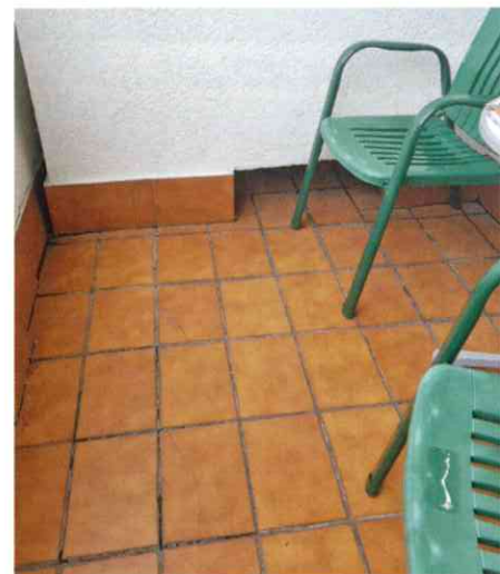
Aufgrund der exponierten Lage wies der alte Fliesenbelag der Balkone Risse und Abplatzungen auf.

Hotelgäste können Blick auf die Hohen Tauern wieder genießen