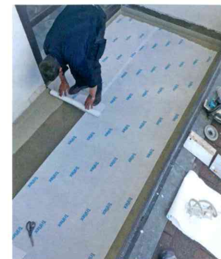
Die Flächenabdichtung wurde mit Triflex ProTerra hergestellt. Bewegungen aus der Konstruktion werden aufgenommen.