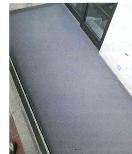
Mit Triflex entsteht langlebiger Schutz der Bausubstanz vor Feuchteintrag und die Böden erhalten eine frische Optik.

Untergrund als Wasserdampf ab. In Verbindung mit dem vollflächig vliesarmierten Balkon Abdichtungssystem Triflex BTS-P entsteht eine langlebige Abdichtung, die Feuchteintrag in die Bausubstanz zuverlässig stoppt und den Böden zugleich wieder eine frische Optik verleiht. Die Vorteile des Balkon Entkopplungssystems Triflex ProDrain: