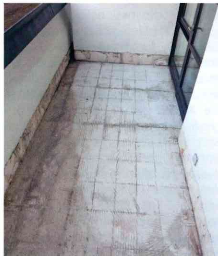
In einem ersten Arbeitsschritt haben die Verarbeiter die alten Fliesen angeschliffen und lose Teile entfernt.