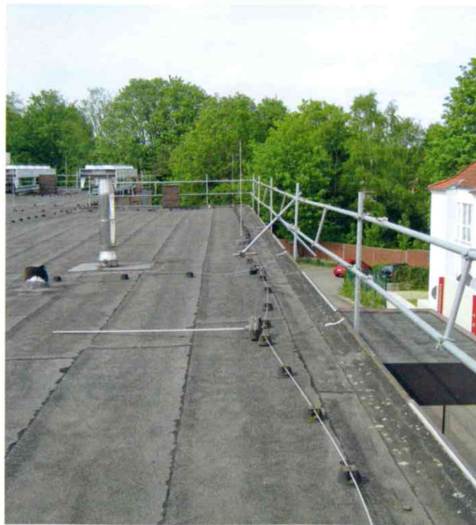
Die SIFATEC Absturzschutzsicherung ist als DGUV-zertifiziertes Arbeitsgerüst bis 40 Meter über Gelände und als Seitenschutz bis 100 Meter über Gelände geprüft.

Herkömmliche Flachdach-Absturzschutzsysteme bestehen in der Regel aus ballastierten Systemen mit Auflasten aus Beton oder Stahl und ragen in L-Form ca. 2,50 Meter in die Dachfläche hinein. Im Gegensatz dazu gewährleistet das SIFATEC Seitenschutz- und Geländersystem ein barrierefreies Arbeiten auf der gesamten Dachfläche. Es lässt sich mit handelsüblichen Gerüstbausystemen kombinieren und bietet deshalb vielfältigste Anwendungsmöglichkeiten, Arbeitsplätze in höher gelegenen Ebenen sicher auszustatten. Der Clou des Systems ist der patentierte Einhängemechanismus. Damit lassen sich die benötigten Gerüstteile