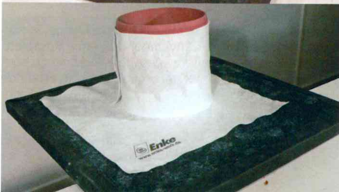
Anpassbar, biegsam, Zu- & Anschnitte, Restteile wieder verwendbar.